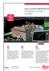
Leica Cyclone REGISTER 360