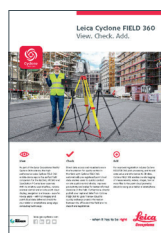
Leica Cyclone FIELD 360