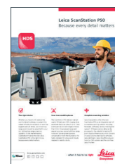
Leica ScanStation P50